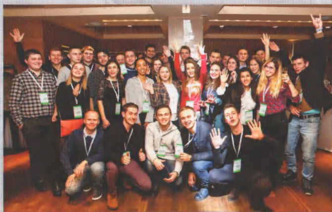
П'яте покоління стипендіатів, 18-12-2018, Київ

Навіть якщо тебе не оберуть стипендіатом, ти здобудеш корисний досвід з розвитку самодисципліни, написання мотиваційного листа та підготовки документів, які ти зможеш використати для інших програм. З іншого боку, чим більше співбесід ти пройдеш, тим упевненіше почуватимешся у майбутньому і тим вищою буде твоя самооцінка.