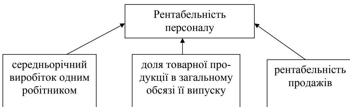
Рис. 1. Структурно-логічна факторна модель рентабельності персоналу [4]

Факторну модель даного показника можна уявити в структурно – логічній моделі (рис.1). Дана модель дозволяє встановити, наскільки змінився прибуток на одного робітника за рахунок рівня рентабельності продажів, питомої ваги виручки в загальному обсязі виробленої продукції та продуктивності праці. Незважаючи на те, що у середньому найбільший вплив на рентабельність персоналу мала рентабельність продажів (більш 90%), аналіз окремо по підприємствам показав, що їх можна розділити на три групи: