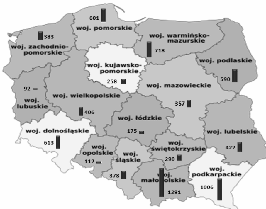
Рис. 2. Агротуристичні підприємства в Польщі за регіонами, 2011 р.

Аналізуючи географічне розташування агротуристичних підприємств можна помітити істотну різницю в їх кількості залежно від регіону. Це є наслідком різної привабливості регіонів та різного рівня ініціативності населення сільських територій, їх досвіду та усвідомлення шансу на розвиток цієї галузі. Найбільша кількість агротуристичних підприємств була в 2010 р. у наступних воєводствах: Малопольському, Підкарпатському та Вармінсько-мазурському, що представлено на рис. 2.