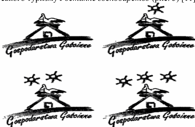
Рис. 3. Система категоризації агротуристичних підприємств у Польщі

Польські підприємці, що займаються сільським зеленим туризмом дуже часто пропонують послуги різного рівня. Слід зазначити, що у Польщі здобуття сертифікатів, котрі підтверджують рівень якості послуг відповідно до стандартів в агротуризмі не є обов'язковим. Добровільну класифікацію та стандартизацію агротуристичних підприємств в Польщі здійснює Польська Федерація Сільськогосподарського туризму Гостинне господарство . Дана федерація поділяє підприємства на категорії, в залежності від рівня стандартів, яких дотримується підприємство. Категорія надається строком на 2 роки. Після завершення терміну дії сертифікату відбувається чергова перевірка та його поновлення, встановлюється рівень стандарту місць для проживання в агротуристичних підприємствах. Після отримання відповідної категорії стандарту агротуристичне підприємство отримує право використовувати знак Федерації Сільськогосподарського туризму Гостинне господарство (рис. 3) [11].